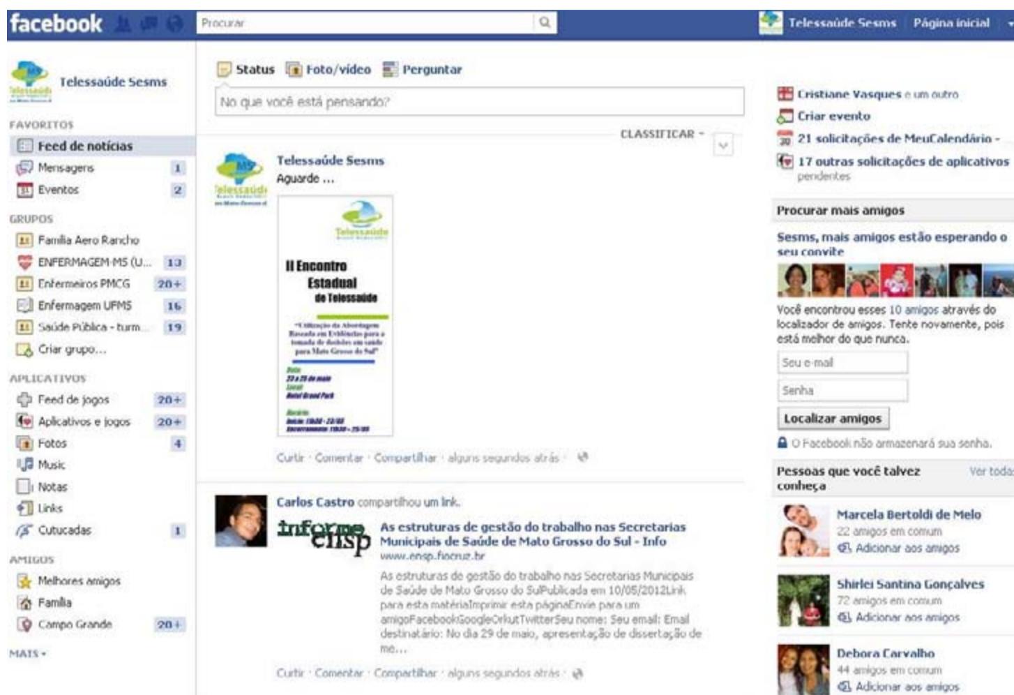
Figura 2 – Página do Telessaúde MS no Facebook, CETEL/DGE/ SES/MS, janeiro 2012.