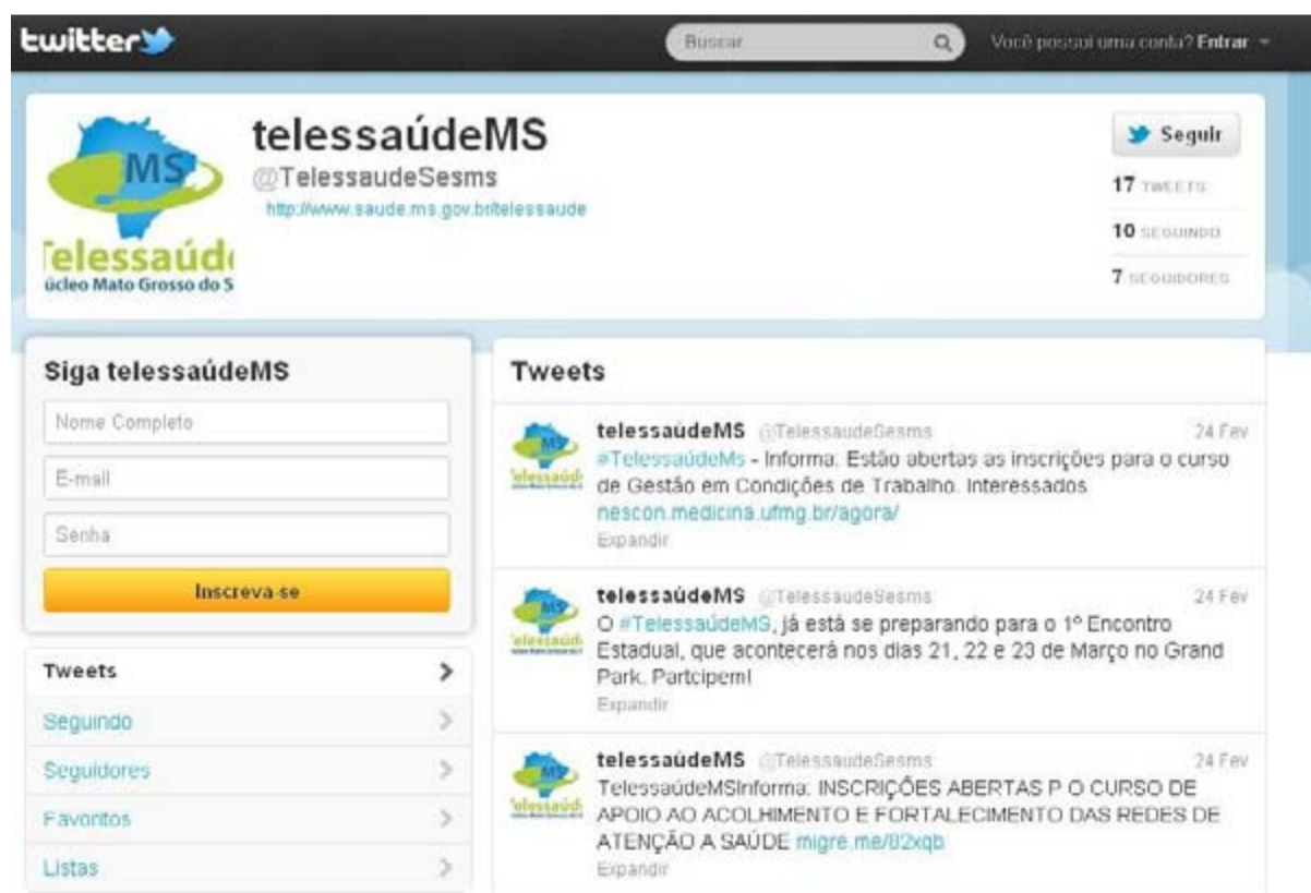
Figura 3 – Página do Telessaúde MS no Twitter ,CETEL/DGE/ SES/MS, janeiro 2012.